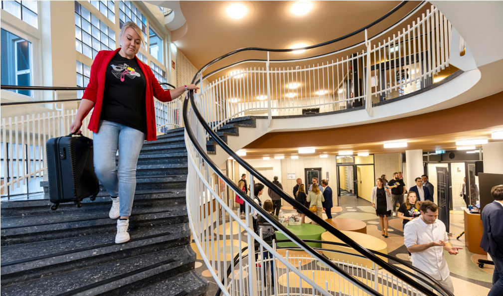
Die markante, geschwungene Treppe im Kern des alten Gesundheitshauses blieb – wie zahlreiche andere Elemente des 1950er-Jahre-Baus – beim Umbau zum Hotel erhalten.

Ein Design-Hotel mit 1950er-Jahre-Charme für Dortmunds Gäste und eine moderne, zweisprachige Tagesstätte für Dortmunds Kinder: Mit diesen beiden Eröffnungen ist das ehemalige Gesundheitshaus im Spätsommer nach dreijährigen Arbeiten aus dem Dornröschenschlaf erwacht. Ein Kundencenter der AOK NordWest sowie einige Wohnungen folgen noch, bis der Umbau des denkmalgeschützten Gebäudes an der Hövelstraße komplett ist.