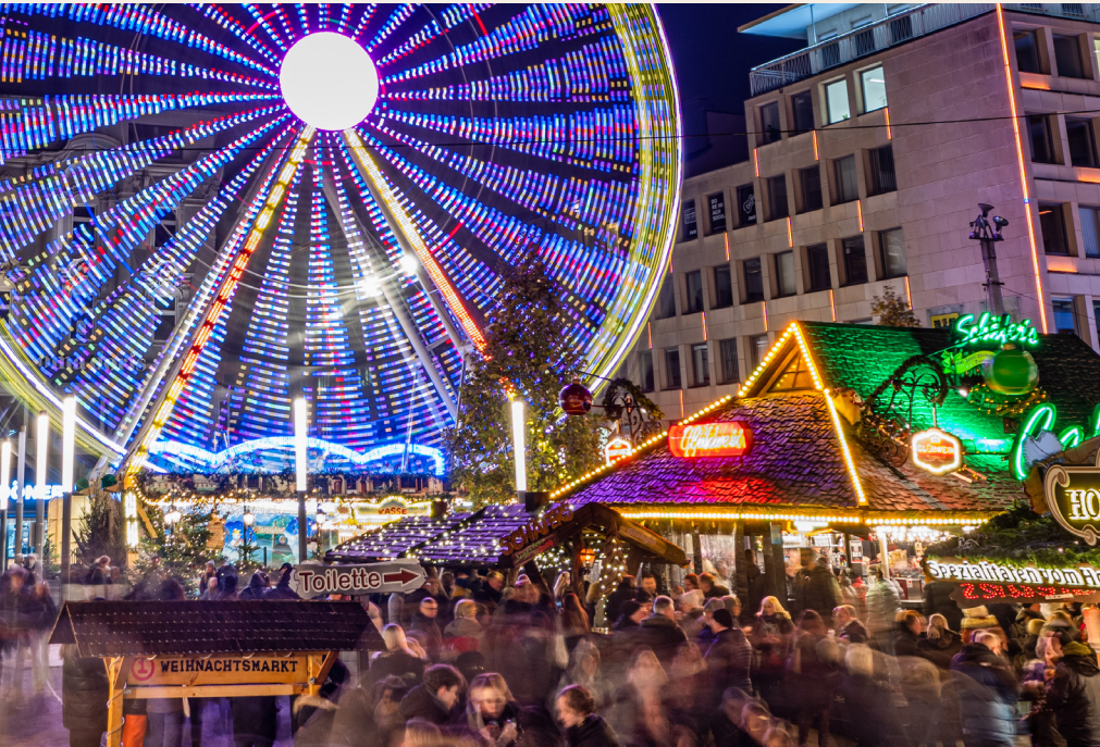
Neben altbekannten Klassikern wie dem Riesenrad hält die Weihnachtsstadt Dortmund ab Donnerstag, 23. November, auch einige Neuerungen für die Besucher*innen bereit.