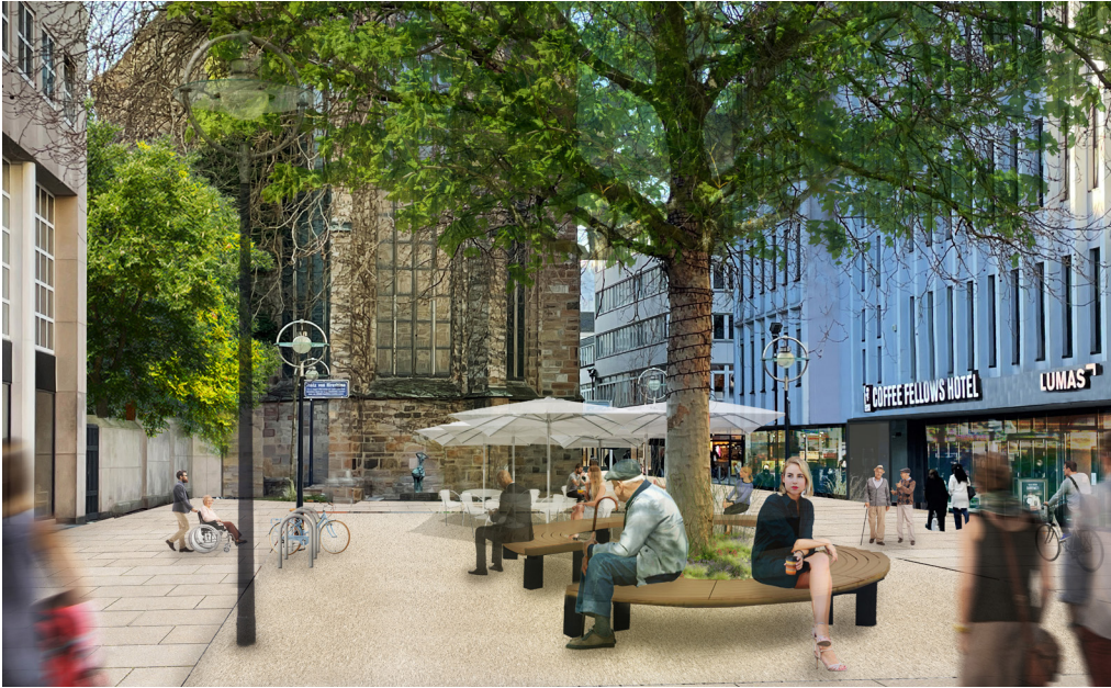
An vielen Stellen wie dem Platz von Hiroshima genügen mehrere kleine Maßnahmen wie eine andere Platzierung von Bänken und Fahrradbügeln oder eine Ergänzung der Leuchtenreihe, um zusammen eine ganz andere Wirkung zu erzeugen (oben rechts). Derzeit wirkt der Platz unruhig, weil die Möblierung aus unterschiedlichen Zeiten stammt und nicht aus einem Guss ist. Die Visualisierung ist ein Beispiel und zeigt auf, worum es beim Masterplan Plätze geht.

Zu einer attraktiven Stadt, in der man gerne unterwegs ist, gehören schön gestaltete Plätze und Straßenzüge. Doch wie steht es um die Plätze in der Dortmunder City? Mit dem Masterplan Plätze hat das Stadtplanungs- und Bauordnungsamt diese Räume in enger Zusammenarbeit mit dem Büro farwickgrote partner unter die Lupe genommen – von markanten Stadträumen wie dem Alten Markt oder dem Hansaplatz bis zu kleineren wie etwa dem Platz von Hiroshima. Über das Ergebnis entscheidet der Rat im Dezember. Die wichtigsten Fragen und Antworten: