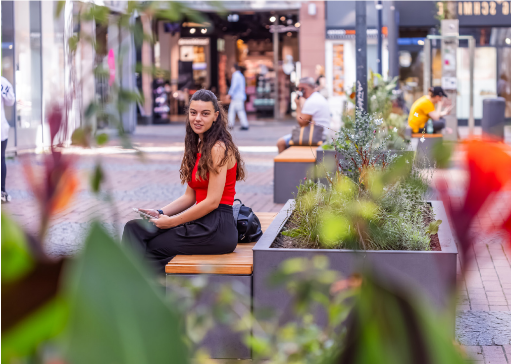
Einfach mal Pause machen und grüne Akzente genießen – das ermöglichen die neuen Kombinationen aus Sitzbänken und Pflanzkübeln, die im Laufe der kommenden Monate an verschiedenen Stellen in der City Station machen.

Gestaltet sind die Pflanzkübel mit einer abwechslungsreichen Auswahl aus Stauden und saisonalen Blumen. Im Laufe des Herbstes werden die großen Baumkübel mit dem heimischen Feldahorn bestückt, die Pflanzgefäße mit Felsenbirnen. In den kommenden Sommern bilden die grünen Möbel so kleine Schattenplätze und lassen zusammen mit zum Beispiel den Blumenampeln die City auch jenseits des Stadtgartens aufblühen.