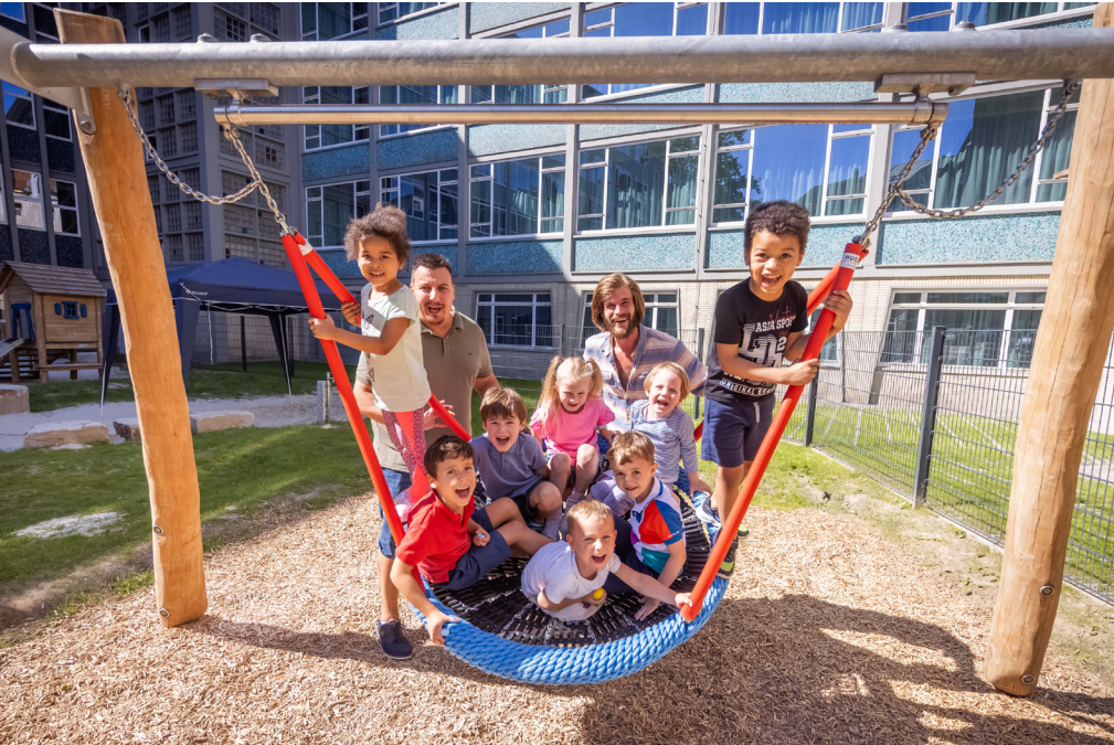
Sowohl die Kinder als auch die Erzieher*innen der Kita „Villa Luna“ fühlen sich seit dem Spätsommer in den modernisierten Räumen der ehemaligen Mütterberatungsstelle und auf dem neugestalteten Außengelände sehr wohl.

Der Architekt Will Schwarz hatte das Gebäude zwischen 1956 und 1961 gebaut. Es gilt als Ikone der modernen Architektur und die farbenfrohe Gestaltung bis ins letzte Detail ist bis heute beispiellos. Will Schwarz wollte, dass sich die Menschen im Inneren dieses einst vielleicht farbenfrohesten Dortmunder Behördenhauses wohlfühlen. Das Gebäude sollte die Besucher*innen schon mit dem Eintritt in das Foyer beim Gesundwerden unterstützen und die Mitarbeitenden des Gesundheitsamtes heiter stimmen. Neben dem wertvollen Terrazzoboden prägt eine sich spindelförmig nach oben windende Stufenkonstruktion das Haupttreppenhaus. Diese und weitere architektonischen Besonderheiten sind erhalten geblieben. Denn die Investorin Landmarken AG hat die Umwandlung des 70 Jahre lang behördlich genutzten Gebäudeensembles in eine lebendige „Mixed-Use-Immobilie“ in enger Zusammenarbeit mit der Unteren Denkmalbehörde der Stadt Dortmund realisiert.