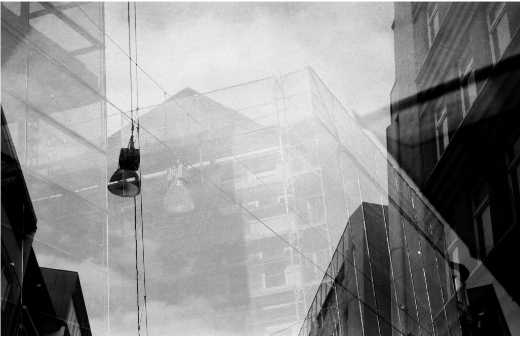
Die Studierende Anna Helm zeigt die City auf diesem kunstvoll komponierten Schwarz-Weiß-Foto mit Mehrfachbelichtung als einen Ort unendlicher Pepita-Muster.